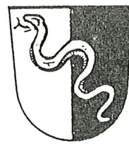
Markt Gars a. Inn