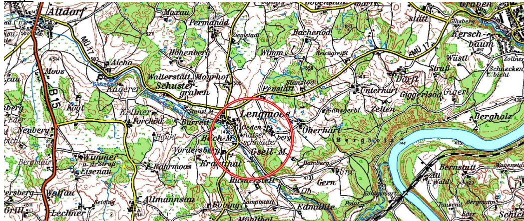
Abb. 1: Lage des Gebiets

Das Planungsgebiet liegt nord-östlich des Inn in Lengmoos, rund 5,2 km vom östlich gelegenen Gars a. Inn entfernt und gehört zum Gemeindegebiet der Marktgemeinde Gars a. Inn.