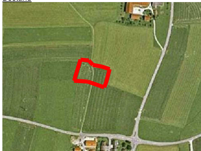
Abb. 2: Darstellung des Bestands im Luftbild