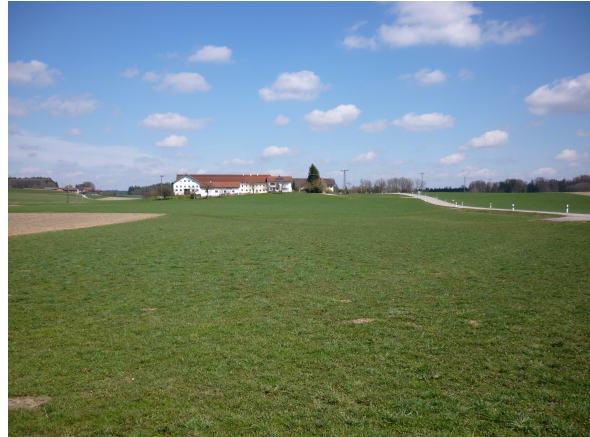
Abb. 4: Gehöft Mayrhof