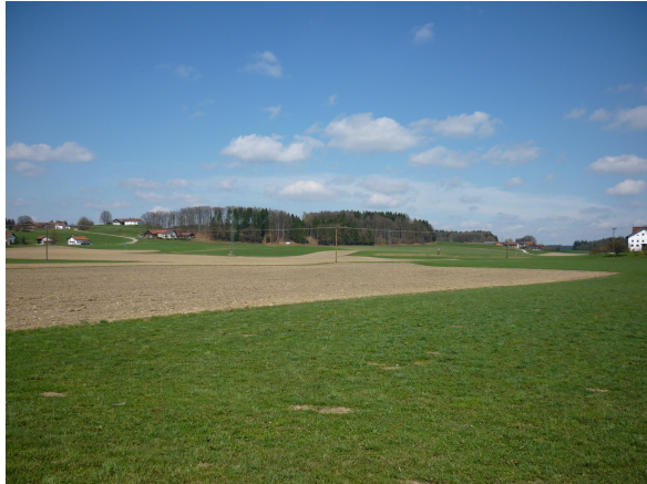
Abb. 3: Landwirtschaftlich genutzte Fläche

Das Planungsgebiet wird begrenzt von Ackerflächen, die jedoch schon bis zur Kreisstrasse Mü 50 im Osten und der Kreisstrasse Mü 17 als Gewerbegebiet ausgewiesen sind. Auf dem gesamten Planungsgebiet existieren keine Gehölze. Im Norden befindet sich in 120 m Entfernung das Gehöft Mayrhof.