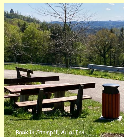
Bank in Stampfl, Au a. Inn

Auch kam in unserem Marktgemeinderat die Idee auf, ob sich nicht grundsätzlich rüstige Rentner oder andere Helfer in unseren Ortsteilen organisieren wollen, um die Instandsetzung der Sitzgruppen und Bänke zu übernehmen und sich um Rückschnitte von Sträuchern und Bäumen an Wegen zu kümmern. Das Material wird von der Gemeinde gestellt und auch eine Brotzeit wird gerne gespendet! Wir freuen uns auf Ihre Rückmeldung.