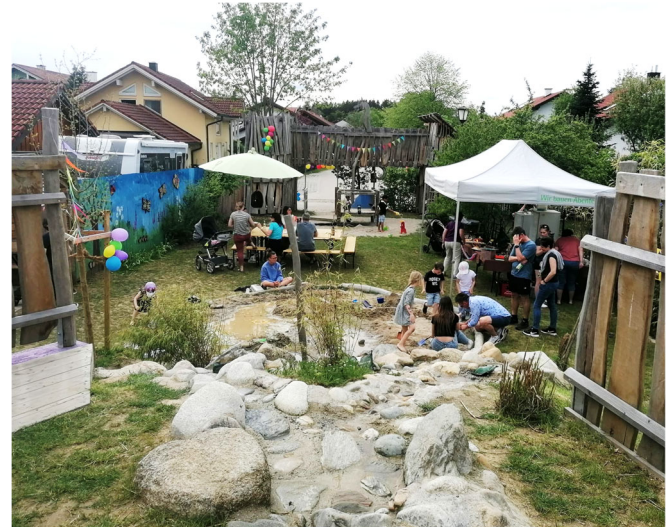
Der neu gestaltete Spielplatz in Stadl

Dank einer Förderung vom Kreisjugendring Bayern sowie Geldspenden von Firmen und Privatpersonen aus dem Ort und der Umgebung konnte dieses Projekt umgesetzt werden. Der neue Spielplatz lädt zum Verweilen und Spielen ein. Neu entstanden sind ein Kletterturm mit Brücke, eine Spielküche, eine Riesenschaukel, eine Kletterwand, eine Rutsche sowie ein fantasievoll gestalteter Wasserlauf mit Zisterne und Ablauf, der riesigen Anklang fand. Nach der feierlichen Eröffnung durften die Kinder "ihren" Spielplatz bespielen, dazu gab es Kaffee & Kuchen, kühle Getränke und leckere Pizzen.