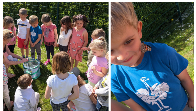
Das Schmetterlingsprojekt in der Blumengruppe

In der Blumengruppe des Kindergartens Unterreit züchteten die Kinder aus kleinen Raupen wunderschöne Distelfalter. Spannend war die Entwicklung von Raupe zur Puppe zum Schmetterling hautnah zu erleben und ganz genau zu beobachten. Ein richtiges AHA Erlebnis.