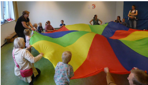
Text & Foto: Kinderhaus St. Antonius

Die „Knaxiade“ gibt es seit mehr als 25 Jahren. Sie wurde vom bayerischen Turnverband und den bayerischen Sparkassen ins Leben gerufen, um dem Bewegungsmangel der Kinder entgegenzuwirken.