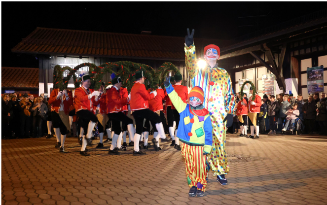
Text & Fotos: Dorfgemeinschaft Grünthal