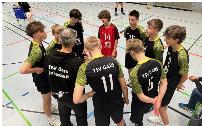
Die Garser Volleyballer U16

Weiter geht's nun mit der Bayerischen Meisterschaft, die am 29. und 30. März in Dachau stattfindet.