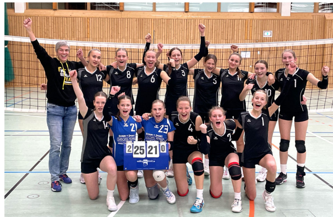
Die Garser Volleyballerinnen U18w

Nach weniger erfolgreichen Teilnahmen in den letzten Jahren sind wir sehr stolz auf unsere Entwicklung und eine Platzierung in der oberen Tabellenhälfte!