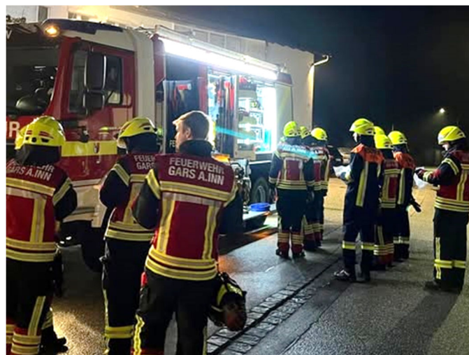
Text & Foto: Feuerwehr Gars a.Inn

Die Kollegen aus Mittergars kümmern sich derzeit um den Garser Maibaum und sind in zwei Jahren bestimmt auch wieder mit dabei!