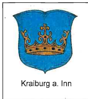
Kraiburg a. Inn