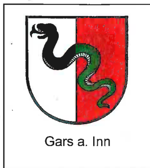
Gars a. Inn